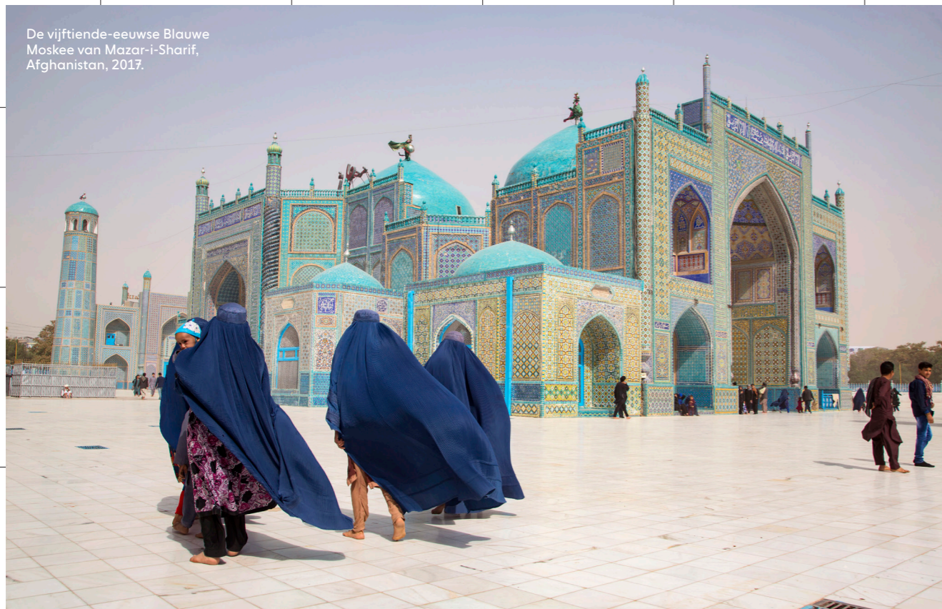
De vijftiende-eeuwse Blauwe Moskee van Mazar-i-Sharif, Afghanistan, 2017.