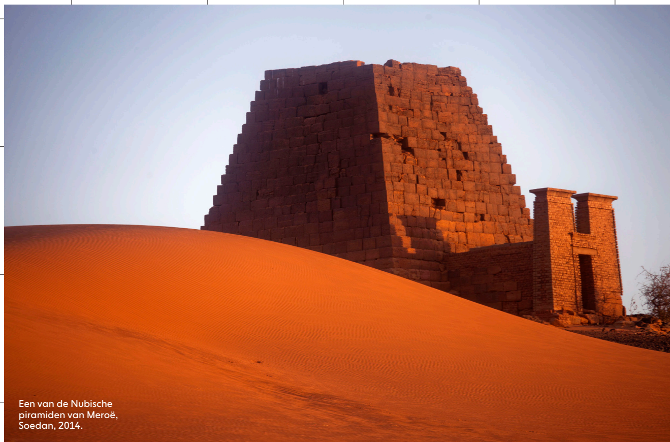
Een van de Nubische piramiden van Meroë, Soedan, 2014.