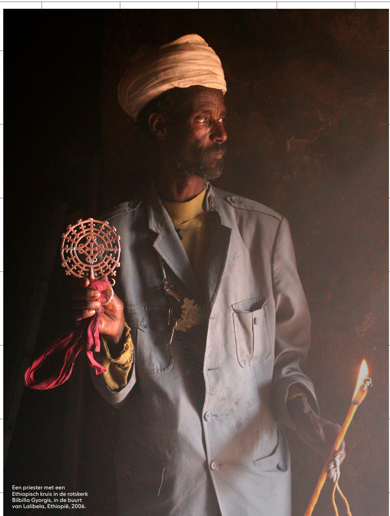
Een priester met een Ethiopisch kruis in de rotskerk Bilbilla Gyorgis, in de buurt van Lalibela, Ethiopië, 2006.